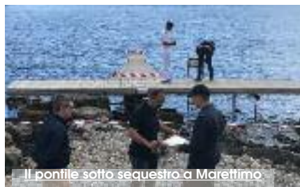
Il pontile sotto sequestro a Marettimo

Militari del Nucleo di Polizia Giudiziaria della Guardia Costiera di Trapani, e personale dell'Ufficio Locale Marittimo di Marettimo, hanno sottoposto a sequestro un'area demaniale marittima dove è stata accertata la realizzazione e il mantenimento di opere insistenti sul litorale in violazione alle vigenti norme in materia di demanio marittimo e dei beni paesaggistici. I militari hanno accertato che le opere erano state realizzate difformemente alla licenza di concessione rilasciata dal competente Assessorato Regionale Territorio e Ambiente di Palermo e mantenute oltre la scadenza del titolo. Inoltre dal punto di vista paesaggistico le opere risultavano in difetto di autorizzazione poiché l'area ricade in zona sottoposta a speciale protezione. Il sequestro preventivo è stato operato su ordine disposto dal Giudice per le Indagini Preliminari e su richiesta della Procura delle Repubblica di Trapani per abusiva occupazione di spazio demaniale marittimo ai sensi degli art. 54 e 1161 del Codice della Navigazione e dell'art. 181 del D.Lgs 42/2004, per aver eseguito opere in assenza di autorizzazioni in area sottoposta a vincoli paesaggistici. (R.T.)