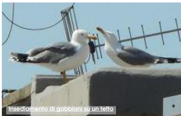
Insedimento di gabbiani su un tetto

tatta prima i Vigili del Fuoco, i quali demandano il problema "gabbiani" alla "Forestale" che rimandano la questione ai Vigili del Fuoco. Un alternarsi di telefonate che pare terminare con la decisione dei Vigili d'inviare presso l'abitazione una squadra. Contrordine dopo pochi minuti: «Non possiamo inviarle la squadra perché i gabbiani sono una specie protetta». Gli uccelli e i loro nidi sono infatti protetti da un'apposita legislazione sulla tutela degli animali selvatici. A questa conclusione si è peraltro giunti con l'ausilio di un volontario della Lipu e di un'associazione di volontari, "Lega del cane" nella sezione di Trapani. In conclusione, nel caso dei gabbiani è possibile adottare misure preventive